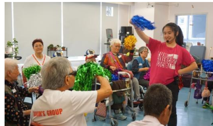
「捨不得完結」的認知訓練