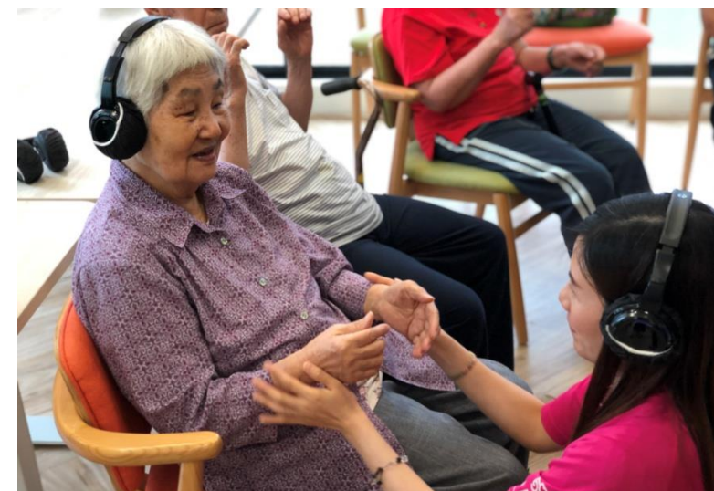
簡單容易的訓練令老友記容易滿足和快樂