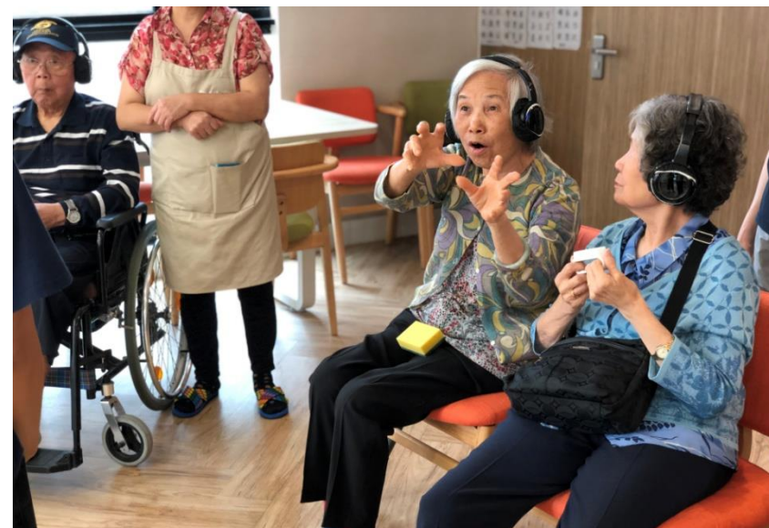
每一位老友記都可以愉快地投入活動